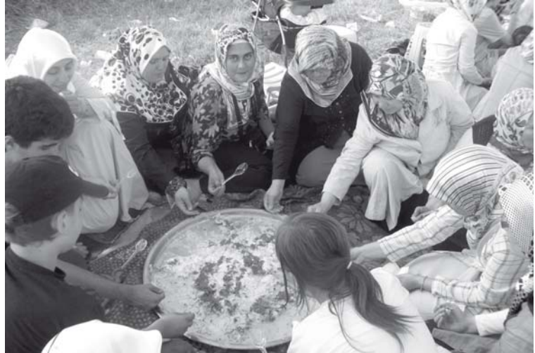
İkincisi gerçekleştirilen şenliğe köy dışında yaşayanların yoğun ilgisi dikkat çekti. Komşu köylerden de Hangel Şenliği'ne iştirak edildi.