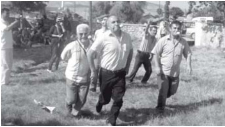
Çeşitli yarışmalar programa renk kattı.