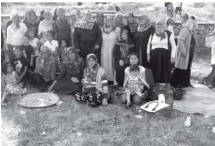
Şenlik sayesinde uzun zamandır birbirini göremeyenler adeta nostalji yaşadılar.

Corum'un Mecitözü İlçesi Kuyucak Köyü'nde geleneksel hale gelen Hangel Şenliği'nin ikincisi hafta sonu gerçekleştirildi.