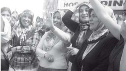
Komşu köylerden de Hangel Şenliği'ne iştirak edildi.