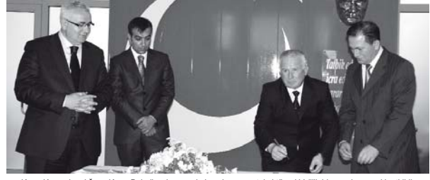
Kargı Kaymakamlığı ve Kargı Belediyesi arasında imzalanan protokol töreni Valilik binasında gerçekleştirildi.