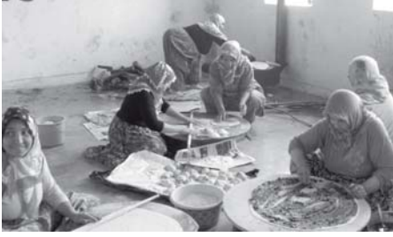
Köyde geleneksel yiyecekler hazırlandı.