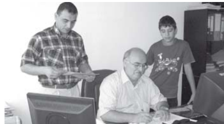
Öğrenci kayıtlarının 27 Ağustos'a kadar süreceği açıklandı.