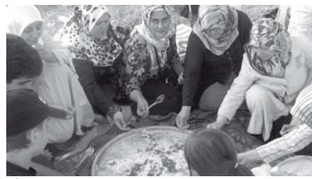
İkincisi gerçekleştirilen şenliğe köy dışında yaşayanların yoğun ilgiyi dikkat çekti. Komşu köylerden de Hangel Şenliği'ne iştirak edildi.